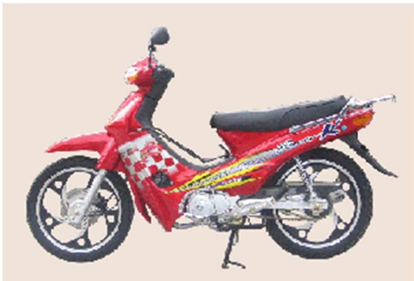
Jakarta moteur Honda de 100 cc boîte semi-automatique

Jour 2 : début de votre randonnée à mobylette via les pistes pour visiter cette belle région. Passage via les forêts classées de Yayem (dégustation de noix de cocos) et Djilor. Passage par la maison de Léopold Sedar Senghor (le premier président du Sénégal) et retour au Lodge de Simal. Repas de midi en brousse un plat local. Repas du matin et du soir au Lodge. +- 70 km