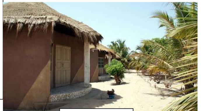
Lodge le Nanaay