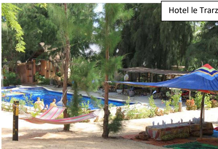
Hotel le Trarza